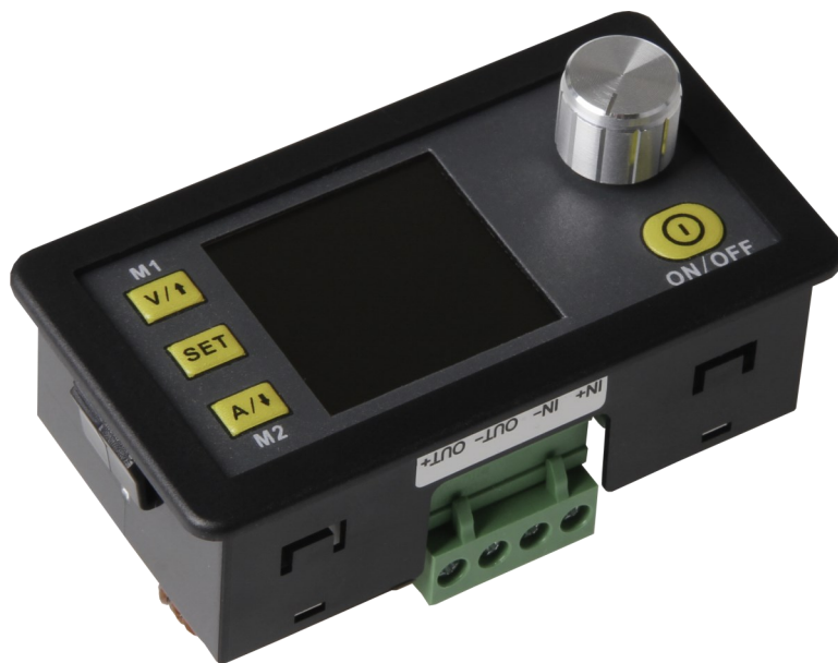
DPS5005 Programmierbares Netzteil